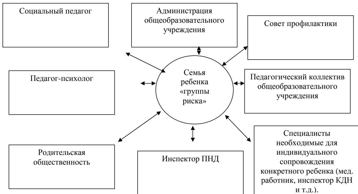
Схема 3 «Организация взаимодействия индивидуального сопровождения для семей ребенка «группы риска»»

полностью отказались от них добровольно. Поэтому гимназия работает и семьями детей группы риска. Результатом диагностического этапа социально-педагогической технологии является составление карт личности[1].